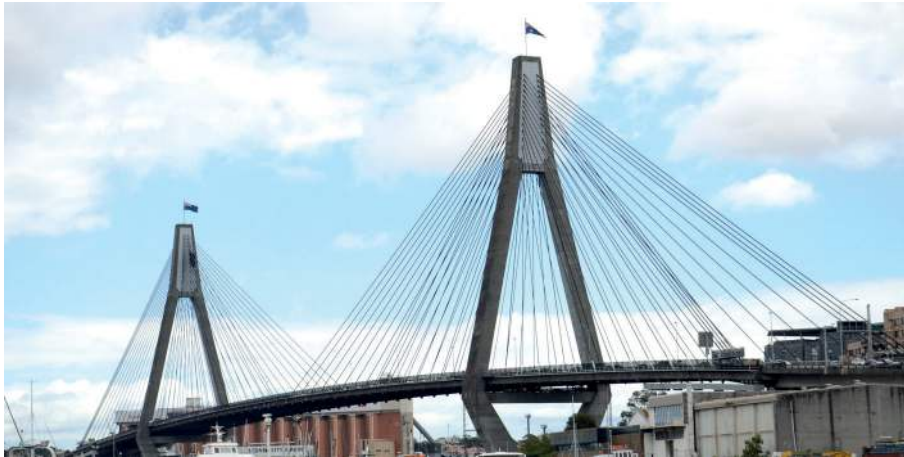
Figura 6: Puente Anzac