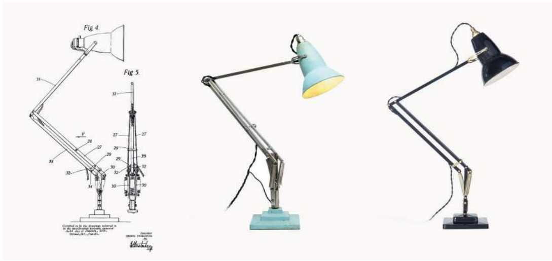
Figura 5: Lámpara Anglepoise