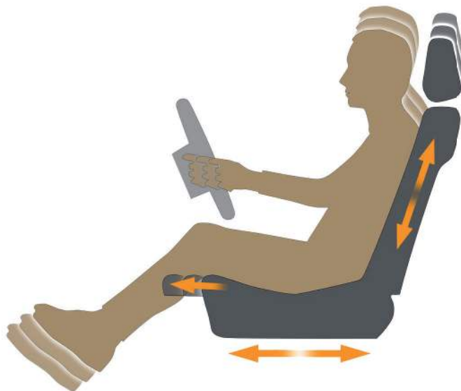
Figura 2: Gráficos en 2D de la ergonomía del interior