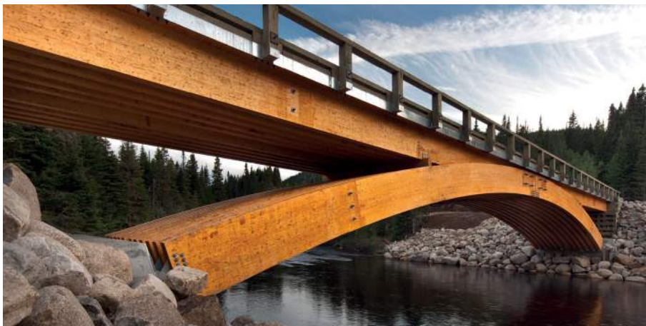
Figura 7: Puente de madera

En otros casos, los diseñadores de puentes han usados materiales tradicionales como madera. En la figura 7 se muestra un puente de madera en Canadá.