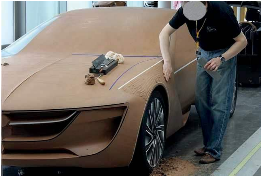
Figura 3: Uso de un modelo en arcilla a tamaño completo