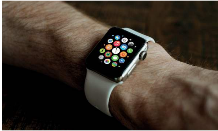
Figura 8: Un smartwatch