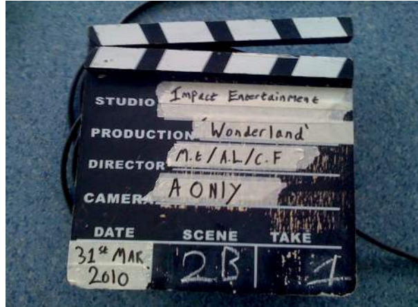
Figura 4: Claqueta tradicional